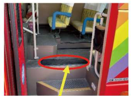
置き去り防止装置