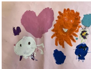
年少児のお友達 「どうぶつ」

Very powerful and colorful painting. I can see everyone is smiling.