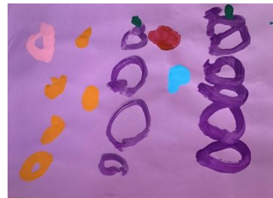
満3歳児のお友達 「くだもの」

かわいいうさぎとくまがかけましたね。おはなもさいえて、どうぶつたちのうきうきしたきぶんがつたわってきます。