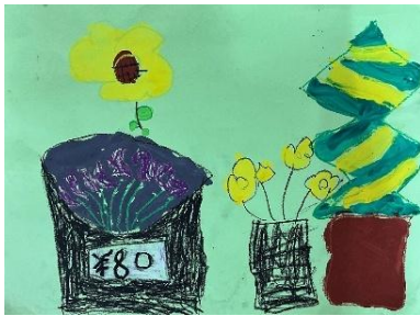
年長児のお友達 「おはな」

2学期の絵画あそびを行いました。赤組は初めて絵の具を使いました。3学期はどんな絵を描こうか今から楽しみにしてくれています。