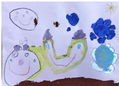
年少児のお友達 「好きな動物」

かわいいうさぎとくまがかけましたね。おはなもさいえて、どうぶつたちのうきうきしたきぶんがつたわってきます。