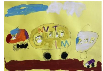
年中児のお友達 「すきないもの」

おかいものがくしゅうでみたおはなをかいてくれました。いろんないろのおはながたくさんあってうれしいきもちになりましたね。