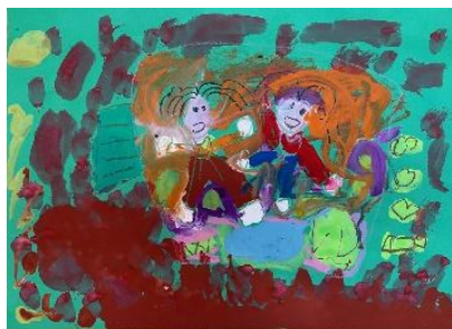
年少児のお友達 「I love them all」

Very powerful and colorful painting. I can see everyone is smiling.