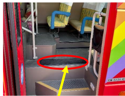
置き去り防止装置