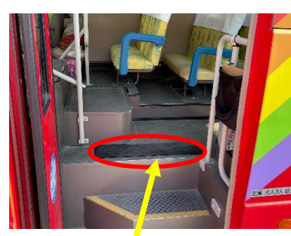
置き去り防止装置